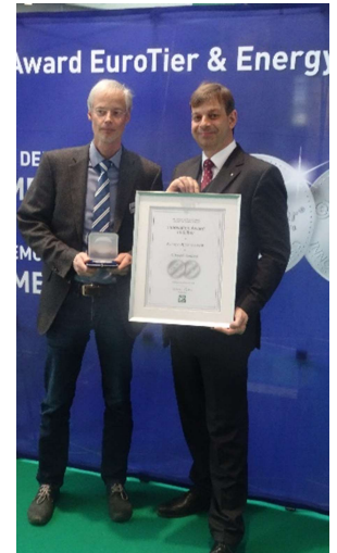
Ausgezeichnet mit einer DLG-Silbermedaille auf der EuroTier 2018

Die besonderen Merkmale des CD-san® - Konzeptes sind seine aufeinander abgestimmten und anwenderfreundlichen 4 Bausteine: